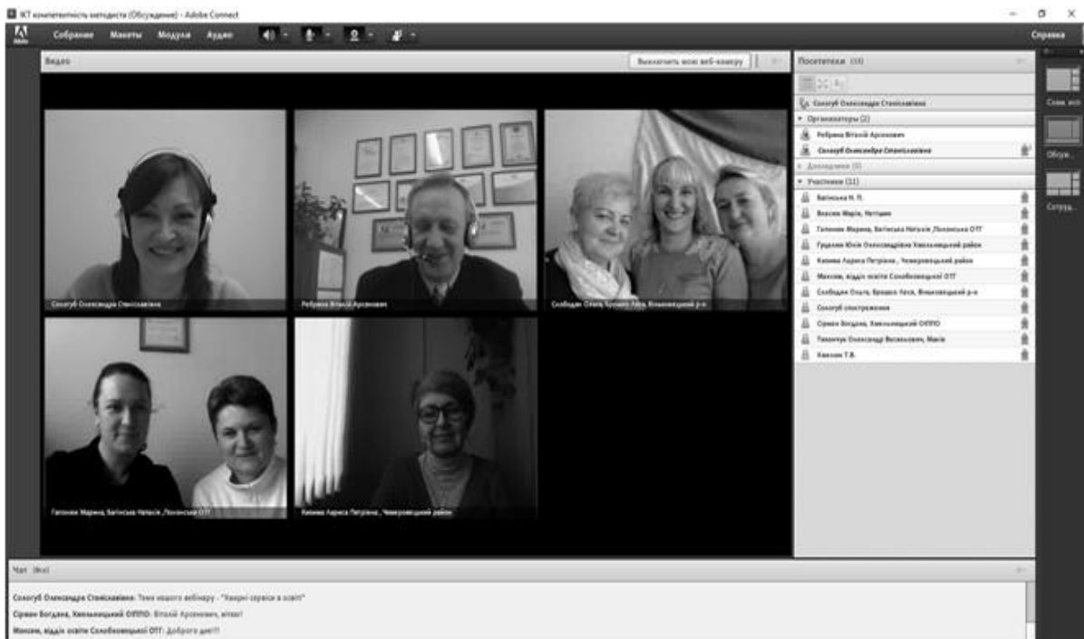
Рис.1. Налаштування камер та мікрофонів перед початком навчального вебінару в кімнаті платформи Adobe Connect

включати камери та мікрофони перед початком кожного вебінару та під час обговорення (рис. 1). Працівників методичних служб не обмежували термінами здачі домашнього завдання, що дозволило їм будувати власну траєкторію навчання.