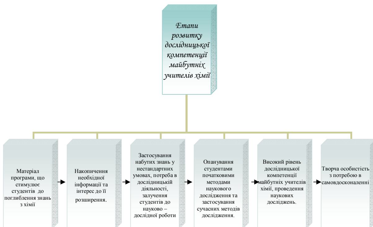
Рис.2. Етапи розвитку дослідницької компетенції майбутніх учителів хімії

Розвитку дослідницької компетенції майбутніх учителів хімії, на нашу думку, сприяють такі форми і методи роботи: