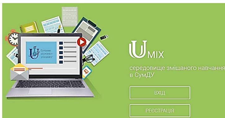
Рис. 1. Титульна сторінка середовища змішаного навчання Міх

В Сумському державному університеті розроблена власна платформа Міх (рис.1), яка відповідає визначеним критеріям до навчальних платформ, таким як надійність в експлуатації, модульність, безпечність, сумісність, зручність у використанні та управлінні [6]. До її переваг також можна віднести простий web-інтерфейс; наявність мобільної версії середовища; можливість редагування свого акаунта; доступність повного звіту щодо входження користувача в систему і роботі над різними навчальними об'єктами; визначення термінів здачі, кількості спроб, максимальної оцінки для завдань і тестів; автоматична оцінка тестів та інтерактивних практичних завдань, сукупність показу оцінок на одній сторінці.