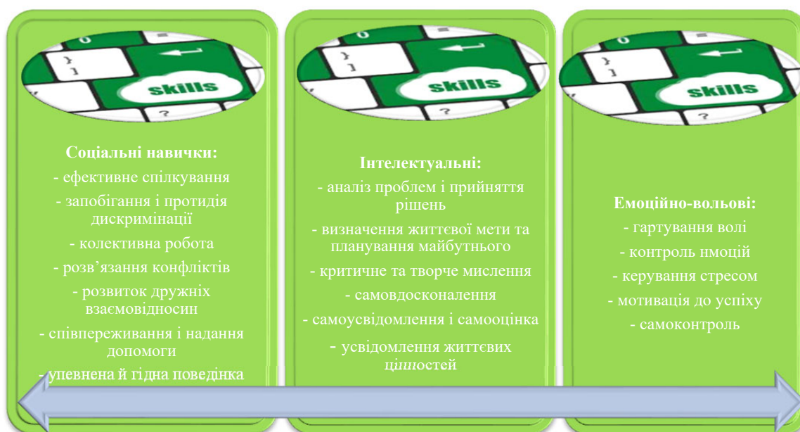
Рис. 1. Життєві навички здорового способу життя

Виклад основного матеріалу. Життєві навички – це соціально-психологічні компетентності, що сформовані ефективними педагогічними технологіями навчання здорового способу життя, які є складовою високоякісної освіти й допомагають людині впоратися з внутрішніми переживаннями та будувати продуктивні стосунки (рис. 1).