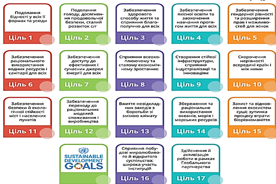
Рис. 1. Цілі сталого розвитку [1]

Виклад основного матеріалу. Сталий туризм незалежно від центру локалізації повинен неодмінно узгоджуватися з Глобальними цілями 2030, або Цілями Сталого Розвитку (рис. 1).