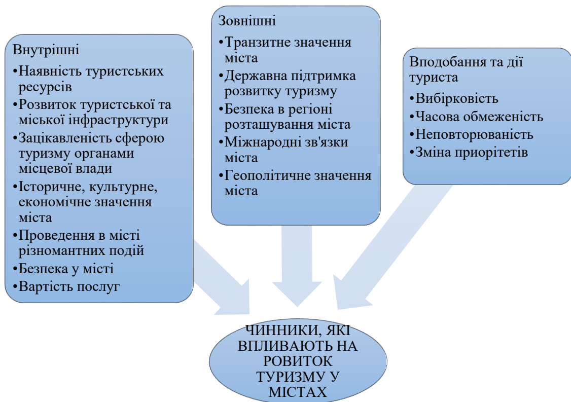
Рис. 1. Чинники, які впливають на розвиток туризму у містах