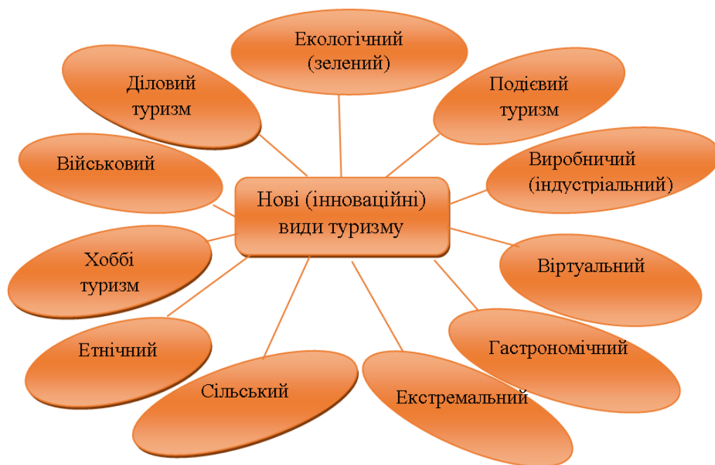
Рис. 1. Класифікація інноваційних видів туризму в Україні (розроблено автором)

Отже, більш детально розглянемо перспективні напрямки розвитку внутрішнього туризму. Перспективними напрямками розвитку внутрішнього туризму в Україні вбачаємо: екологічний туризм, віртуальний, військовий туризм. Україна володіє достатніми екотуристичними ресурсами для розвитку екологічного туризму, має оптимальне поєднання природно-ресурсних умов для розвитку гірського туризму, зокрема екстремальних його видів.