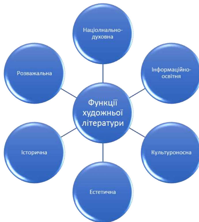
Рис.1.2. Функції художньої літератури у розвитку художньо-мовленнєвої діяльності дітей старшого дошкільного віку

Аналізуючи подану схему, де зазначені функції художньої літератури у розвитку художньо-мовленнєвої діяльності, варто зазначити, що кожна з них несе власне навантаження у розвитку художньо-мовленнєвої діяльності дітей старшого дошкільного віку. Інформаційно-освітня – художні твори несуть певну інформацію про життєві події, явища і закони природи; виховна – художні твори сприяють формуванню у дітей уявлень про довкілля, про правила і етичність поведінки, про закони людського буття; національно-духовна – художні твори формують національну свідомість, національний менталітет, високу духовність, яка притаманна українському народові; історична – художня література розповідає дітям про історію народу, його традиції, звичаї, обереги; культуроносна – художня література є носієм національної культури, сприяє висококультурному розвитку дитини; розважальна функція – багато творів для дітей викликають у них сміх, радість, веселощі, спонукають до розваг. Жодна з вище зазначених функцій не існує