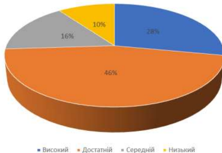
Рис. 1.3. Розподіл дітей за критеріями сформованості літературної компетентності

Отримані дані свідчать, що у дітей старшого дошкільного віку мало розвинений фонематичний слух, деякі діти потребують роботи з логопедом. Ми зробили висновок, що чітка артикуляція і темпи оволодіння правильною звуковимовою залежать від індивідуальних особливостей будови мовленнєвого апарату і розвитку фонематичного слуху. Щоб ліквідувати такі прогалини, вихователю необхідно проводити різні види вправ з аудіювання, у яких представлено одиниці різних мовних рівнів: звуки, слова, словосполучення, речення; ознайомлювати дітей з різними напрямками діяльності, що стимулюють художньо-мовленнєву активність дітей дошкільного віку.