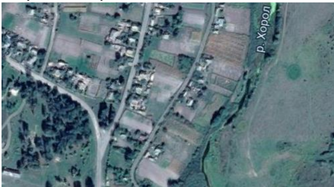
Рис. 4. Космічний знімок русла Хоролу (с. Ручки) в межах лучної антропогенізованої геосистеми

Учень зробив відповідний висновок, що різна водність Хоролу пов'язана з тим, що ліс створює більш сприятливі умови для поглинання води ґрунтом, поліпшує умови живлення підземних вод, тобто переводить поверхневий стік у підземний. Також у лісі ймовірність ерозійних процесів є мінімальною. А на відкритих просторах створюються більш сприятливі умови для поширення прибережно-водної рослинності, що в свою чергу призводить до уповільнення течії та замулення. Останнє особливо активно посилюється при наявності поселенських та городніх ландшафтів.