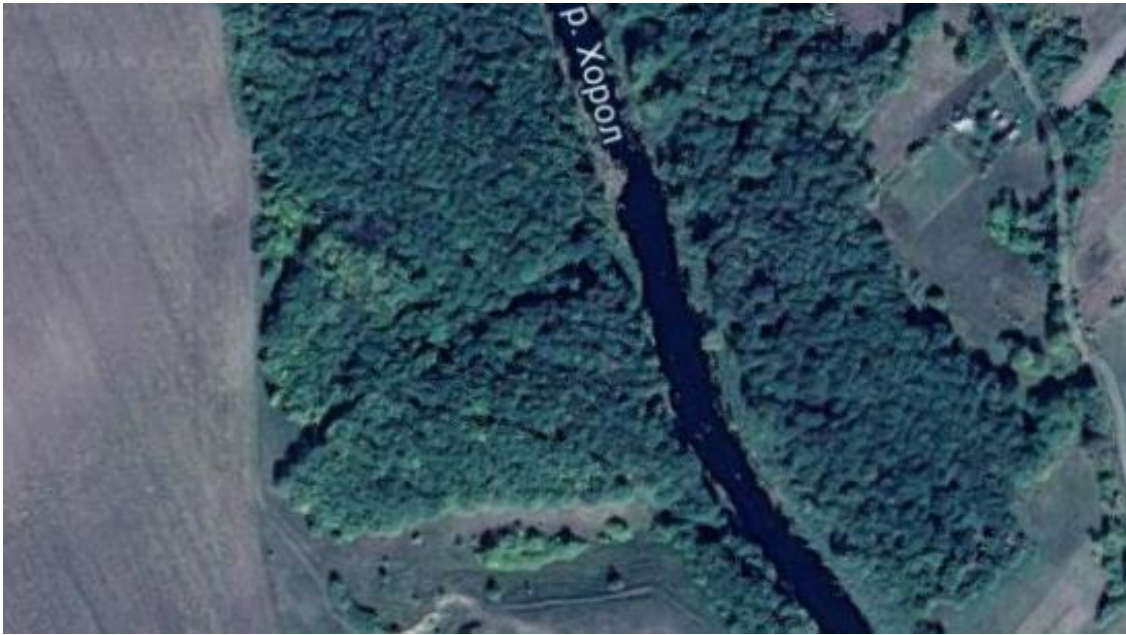
Рис. 3. Космічний знімок русла Хоролу (с. Ручки) в межах геосистеми

ривчастий характер. Підтвердженням цього стали космічні знімки околиць села Ручки (рис. 3, 4).