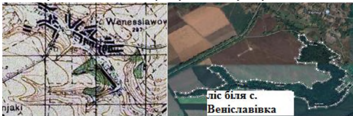
Рис. 4. Фрагменти карт частини басейну річки Татарина біля села Веніславівка, на яких можна спостерігати залісненість території (ліворуч – станом на 1931 рік; праворуч – станом на 1983 рік)

Таким чином, можна стверджувати, що стан річкового басейну Татарини значною мірою залежить від впливу антропогенних факторів.