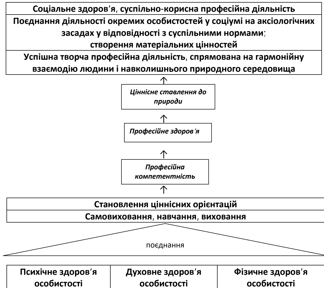
Схема 1. Схема формування безпечного професійного становлення фахівців аграрного комплексу

духовне здоров'я, з огляду на пріоритет здоров'я, викладені вище дослідження та визначення даного поняття, специфіку діяльності аграріїв, ми розробили схему формування безпечного професійного становлення фахівців аграрного комплексу з урахуванням усіх складових здоров'я (схема 1).