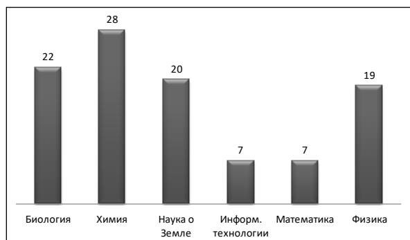
Рис. 2. Количество НИР в разделе «Естественные науки» в 2018/19 учебном году

В 2019 году было награждено 182 работы (45%) и 223 ученика (48%). Из них 39 получили первое место, 61 – второе место и 82 – третье место (рис. 3).