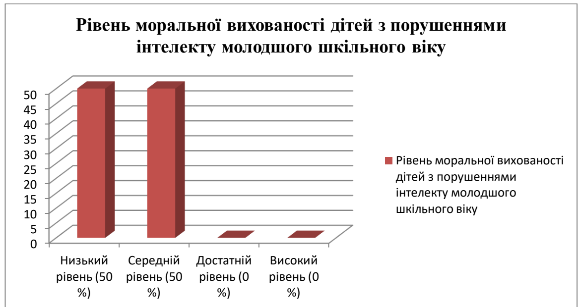
Рис. 2.1. Рівень моральної вихованості учнів із порушеннями інтелекту молодшого шкільного віку на констатувальному етапі дослідження

Констатувальний етап нашого дослідження проводився з листопада по грудень 2020 року. Аналіз учнівської документації, спостереження, бесіди, анкетування педагогів та батьків, проєктивна методика та математичні методи дослідження дали підстави зробити висновки, що рівень сформованості моральної вихованості в учнів із порушеннями інтелектуального розвитку перебуває на низькому та середньому рівнях. Зокрема 4 учні (50 % від всіх досліджуваних) перебувало на низькому рівні та 4 (50 %) дитини з порушеннями інтелекту на момент проведення констатувального експерименту перебували на середньому рівні моральної вихованості (див. рис. 2.1.).