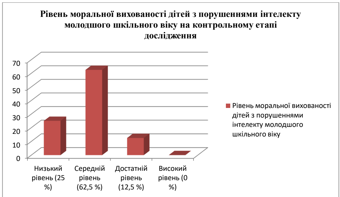
Рис. 3.1. Рівень моральної вихованості учнів із порушеннями інтелекту молодшого шкільного віку на контрольному етапі дослідження

Шляхом використання математичного обчислення нами було узагальнено рівні моральної вихованості у школярів із порушеннями інтелектуального розвитку молодшого шкільного віку, які навчалися в інклюзивних класах Опорного Середино-Будського закладу загальної середньої освіти I-III ступенів № 1 Середино-Будської міської ради, Опорного Середино-Будського закладу загальної середньої освіти I-III ступенів № 2 Середино-Будської міської ради, Старогутського навчально-виховного комплексу «Заклад загальної середньої освіти I-III ступенів – заклад дошкільної освіти» Середино-Будської міської ради та Чернацького навчально-виховного комплексу «Заклад загальної середньої освіти I-III ступенів – заклад дошкільної освіти» Середино-Будської міської ради. У таблиці 3.1 ми навели порівняння результатів констатувального та контрольного етапів експерименту (у відсотках).