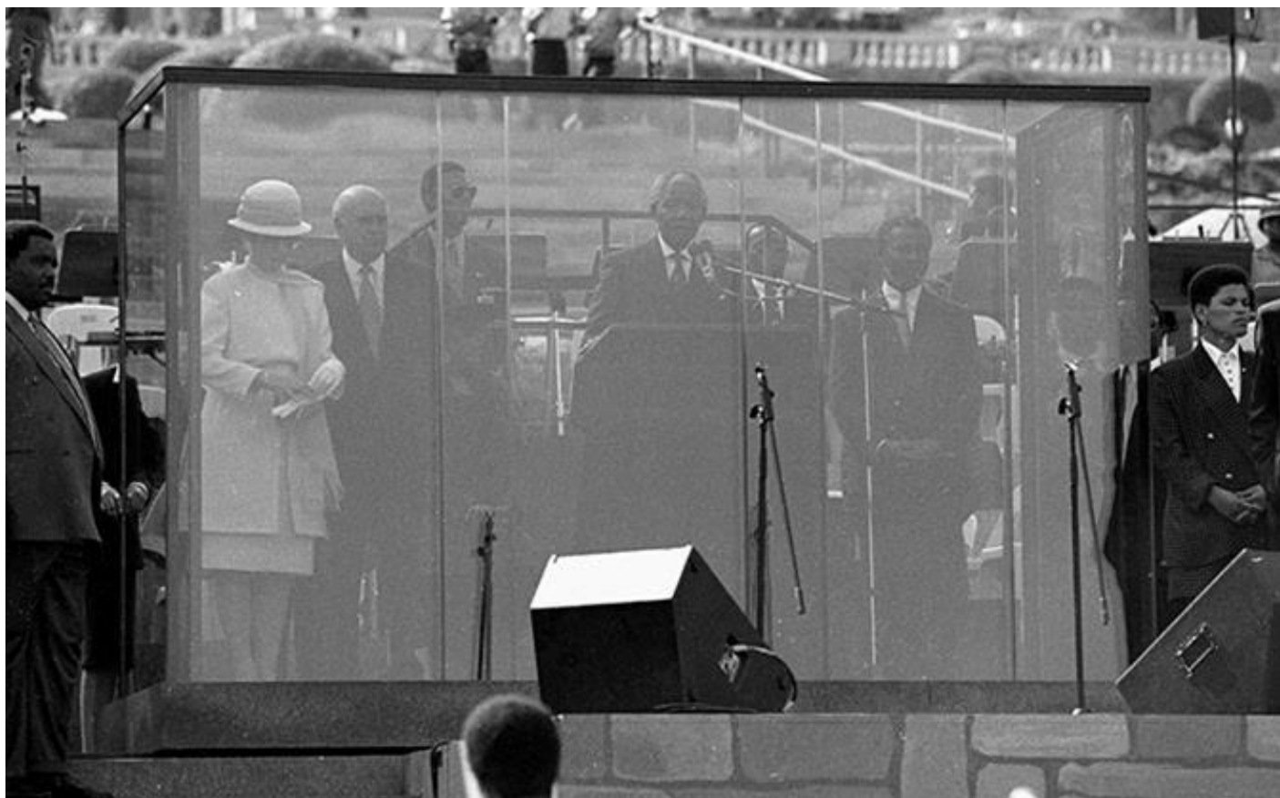
Рисунок Г. 1 Виступ Нельсона Мандели за куленепробивним склом на церемонії інавгурації 1994 р.