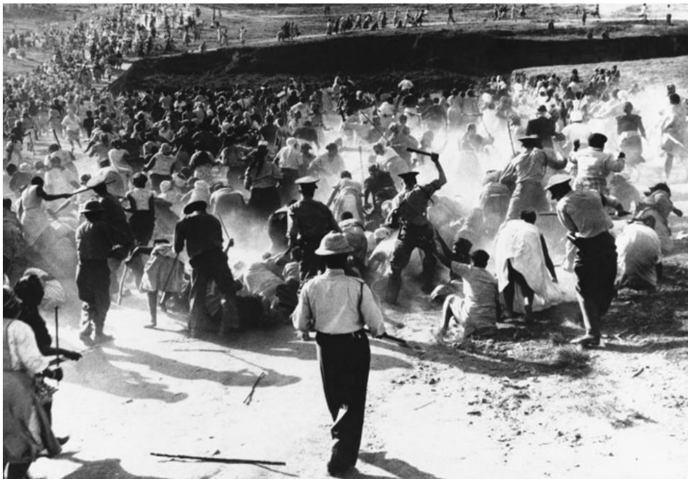
Рисунок А.1 Шарпівільська стрілянина 1960 р.