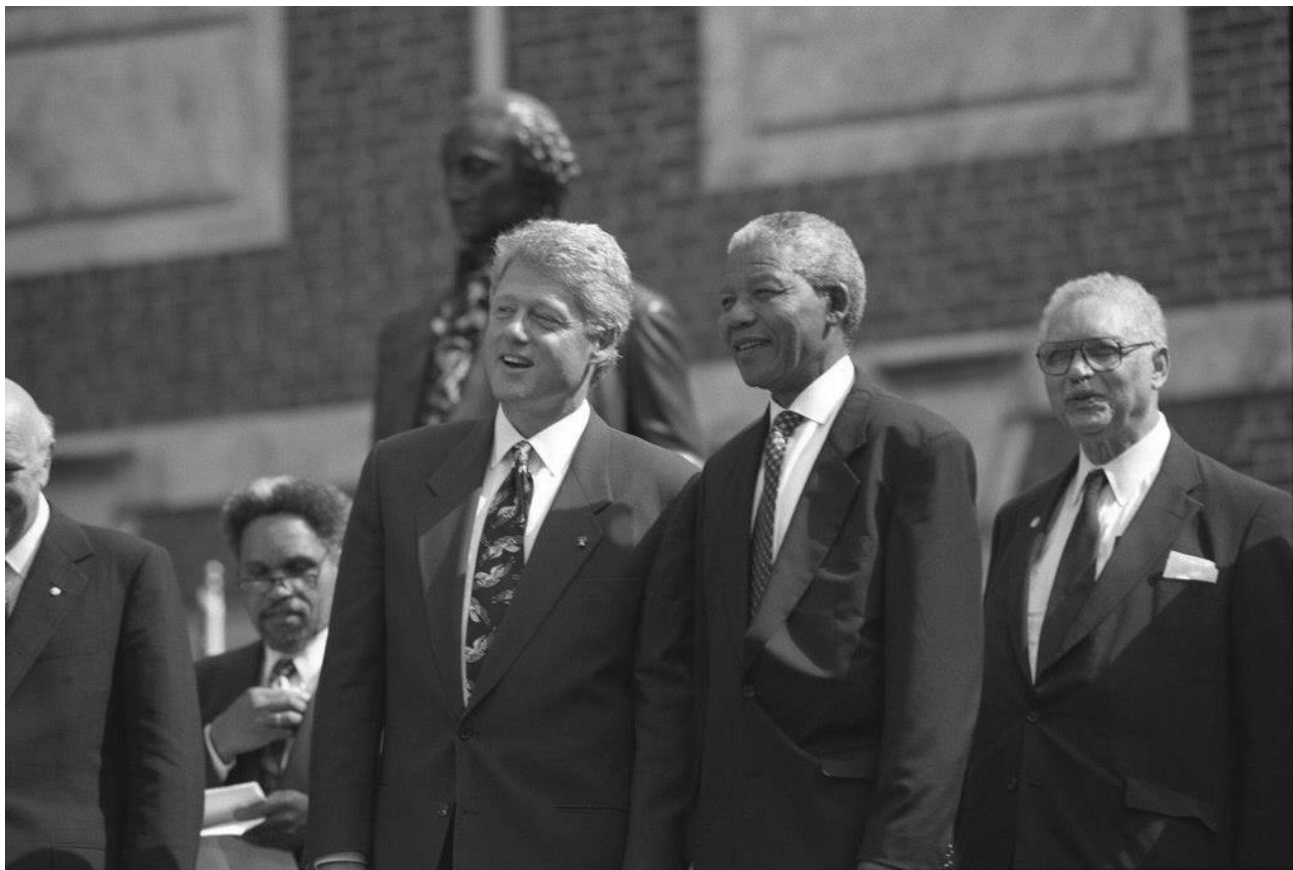
Рисунок Д. 1 Нельсон Мандела з президентом США Біллом Клінтоном 1998 р.