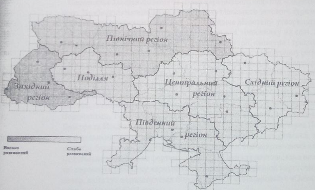
Рис. 2. Інтенсивність розвитку сільського зеленого туризму в Україні

Кожен регіон в Україні має всі необхідні ресурси для розвитку сільського зеленого туризму (рис. 2).