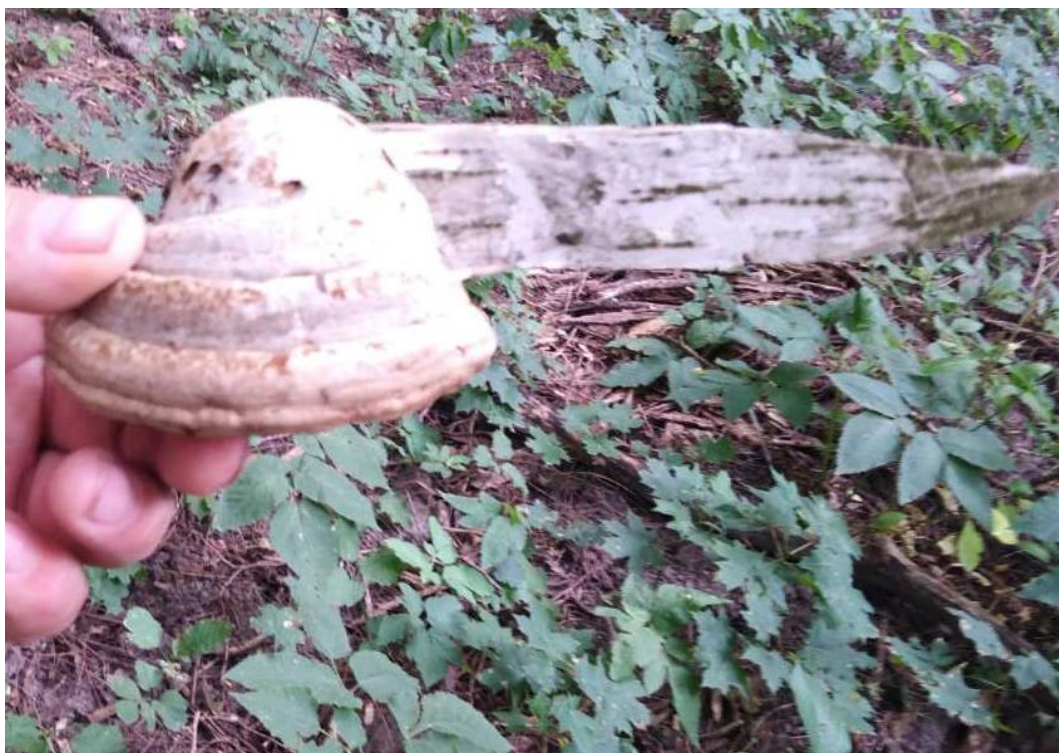
. Трутовик справжній – Fomes fomentarius (Fr.) Gill. На стовбурах Acer platanoides L.,