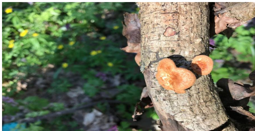
Інонот щетинисто-волосистий (Трутовий щетинисто-волосистий) – Inonotus hispidus (Bull.) P. Karst., На гілці Malus domestica Borkh.,