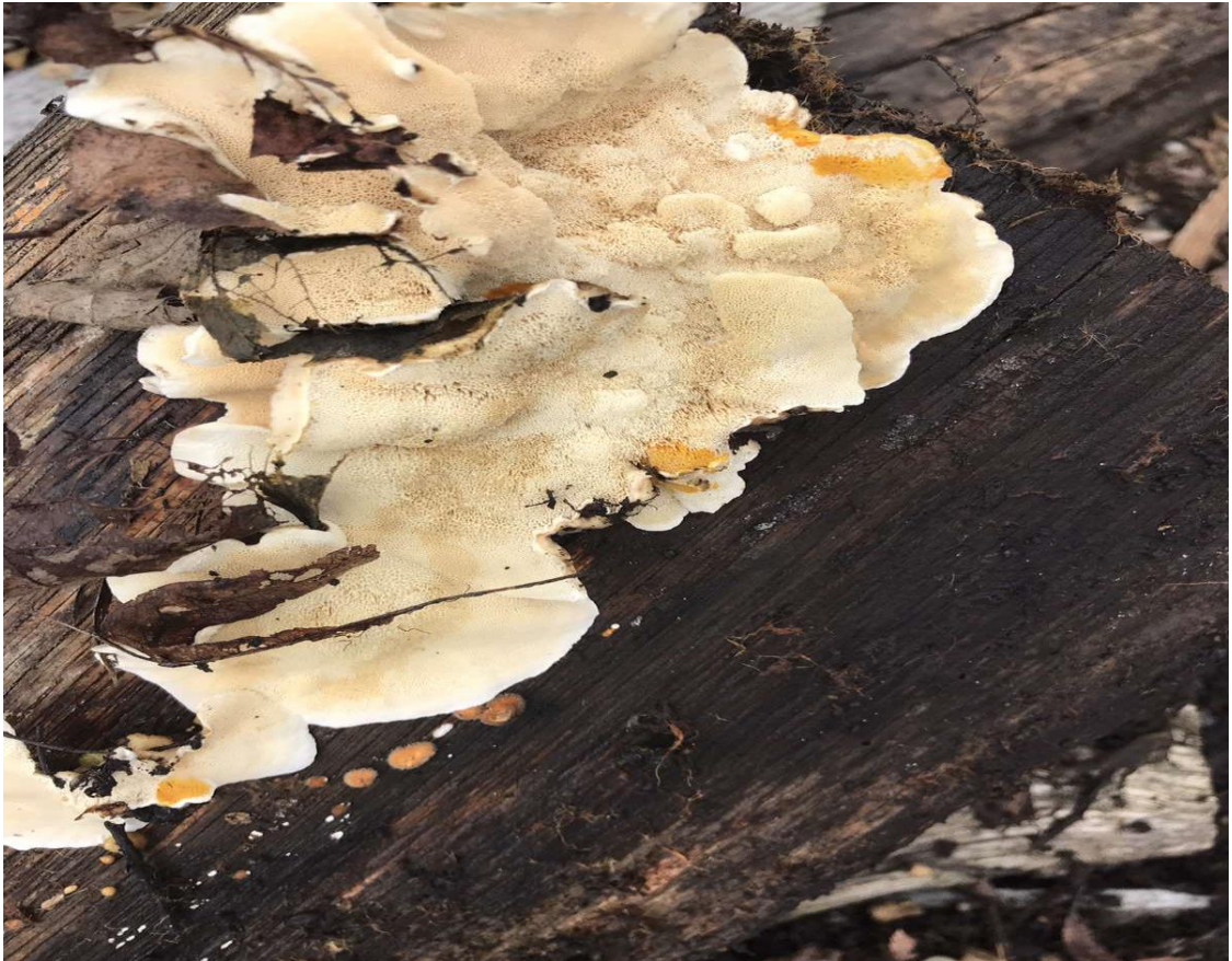
Ірпекс молочно-білий – Irpex lacteus (Fr.) Fr. На гнилій деревині.