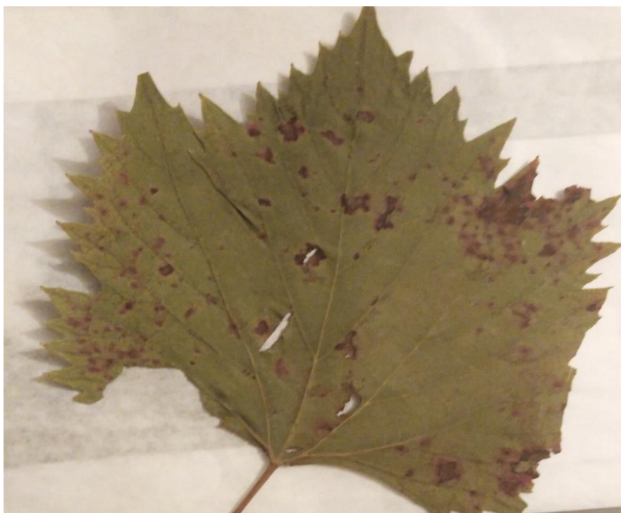
Плазмopара виноградова – Plasmopara viticola (Berk et M. A. Curtis) Besl. et De Toni. На Vitis sp.