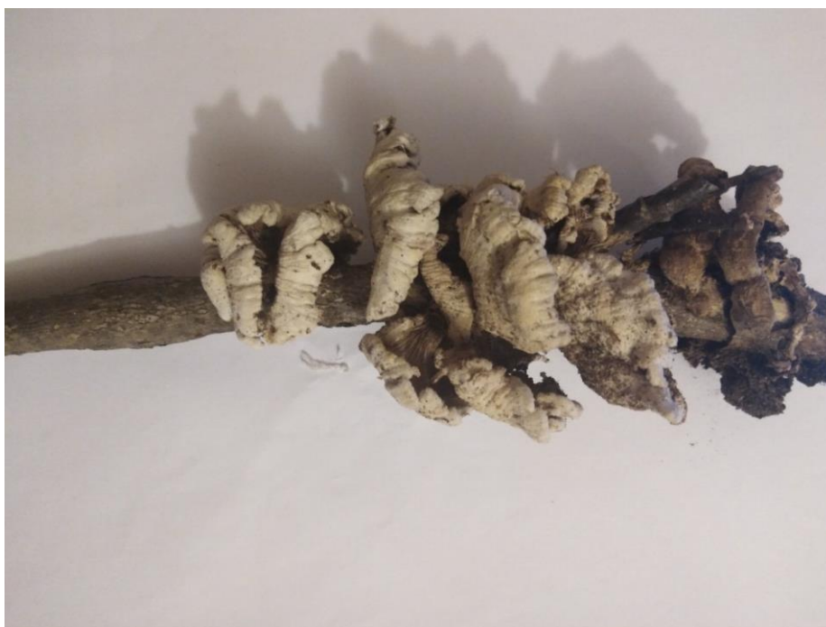
Поліпор - Polyporus . На опалій гілці.