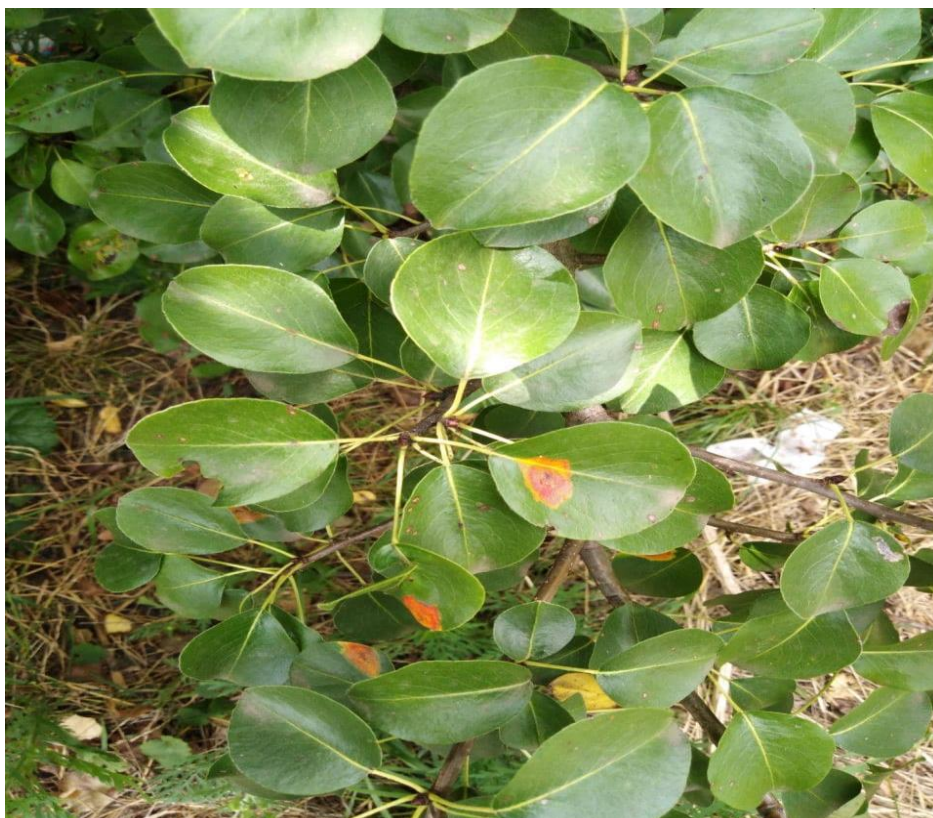
Gymnosporangium sabinae (Dicks.) G. Winter. На листках Pyrus communis L.