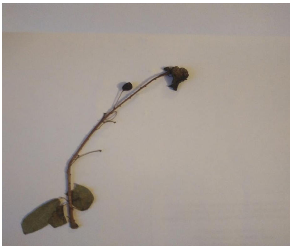
Тафрина сливова – Taphrina pruni Tul., На Prunus padus L.