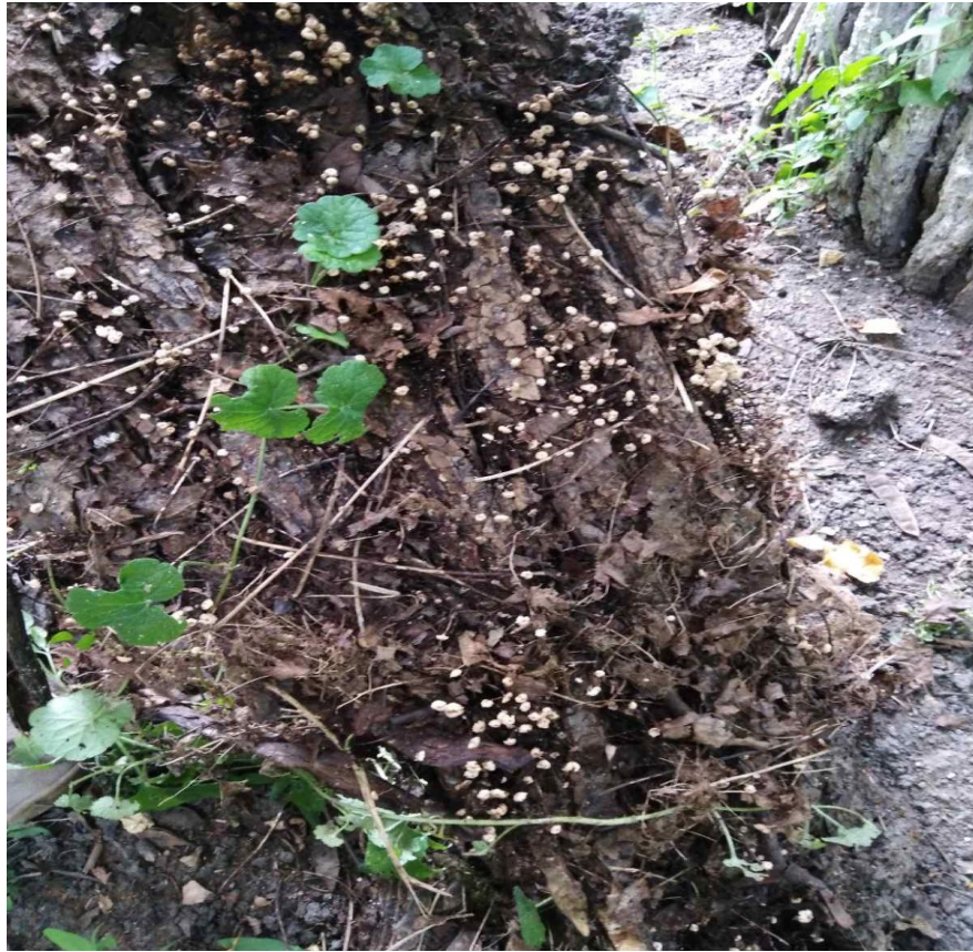
Копринел розсіяний – Coprinellus disseminatus (Pers.) J.E.Lange. На мертвій деревині листяних дерев,