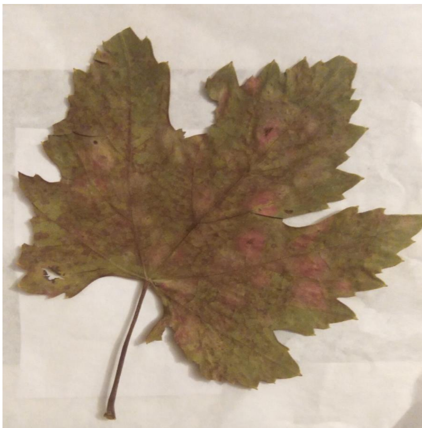
Еризіфе _____ – Erysiphe _____. На Vitis L.