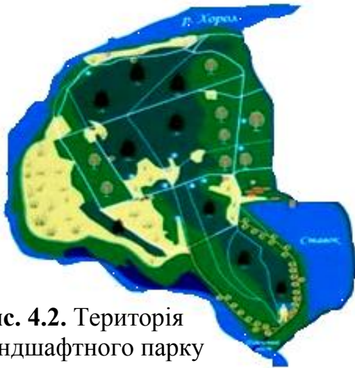
Рис. 4.2. Територія ландшафтного парку «Березовий гай»

Ландшафтних заказник місцевого значення «Березовий гай» ( далі –ЛЗ «Березовий гай»). Територія ландшафтного парку-заповідника розташована у північно-східній частині міста Миргорода і входить до лісопаркової зони курорту «Миргород». Загальна площа – 63,9 га (рис. 4.2.). Переважно це заплава р. Хорол, лівий берег якої обмежує парк з півночі, заходу та півдня. Парк виконує функції зберігання та відновлення особливо цінних природних ландшафтів і підтримання загального екологічного балансу.