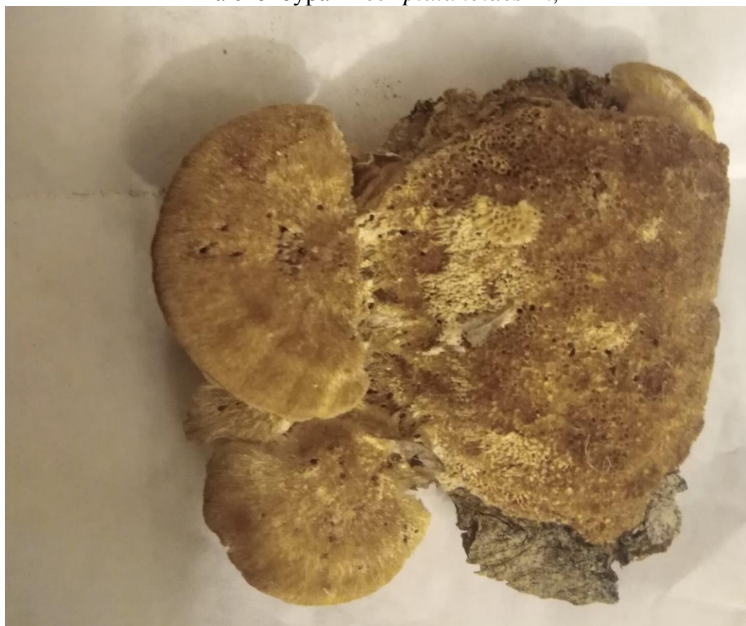
Трутовик жорстковолосистий – Trametes hirsuta (Wulfen) Lloyd. На Ulmus minor Mill.,