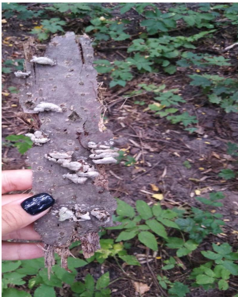
Схізофіл звичайний – Schizophyllum commune Fr. На стовбурах Tilia cordata Mill.,