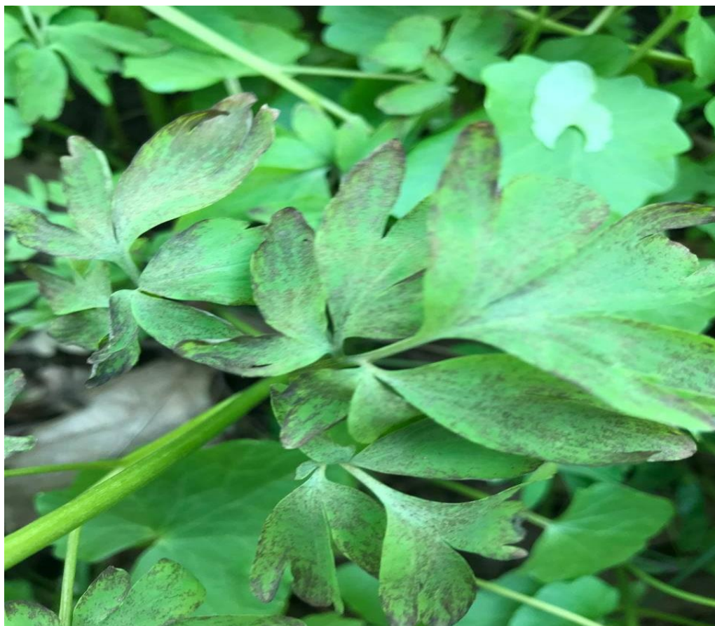
Пероноспора рястова – Peronospora corydalis de Bary. На Corydalis solida