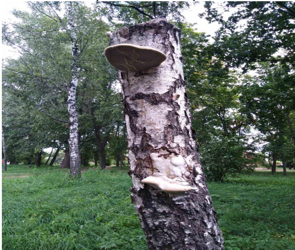
Трутовик плоский (Ганодерма блискуча) – Ganoderma applanatum (PERS.) RAT. На пнях Betula pendula ROTH.