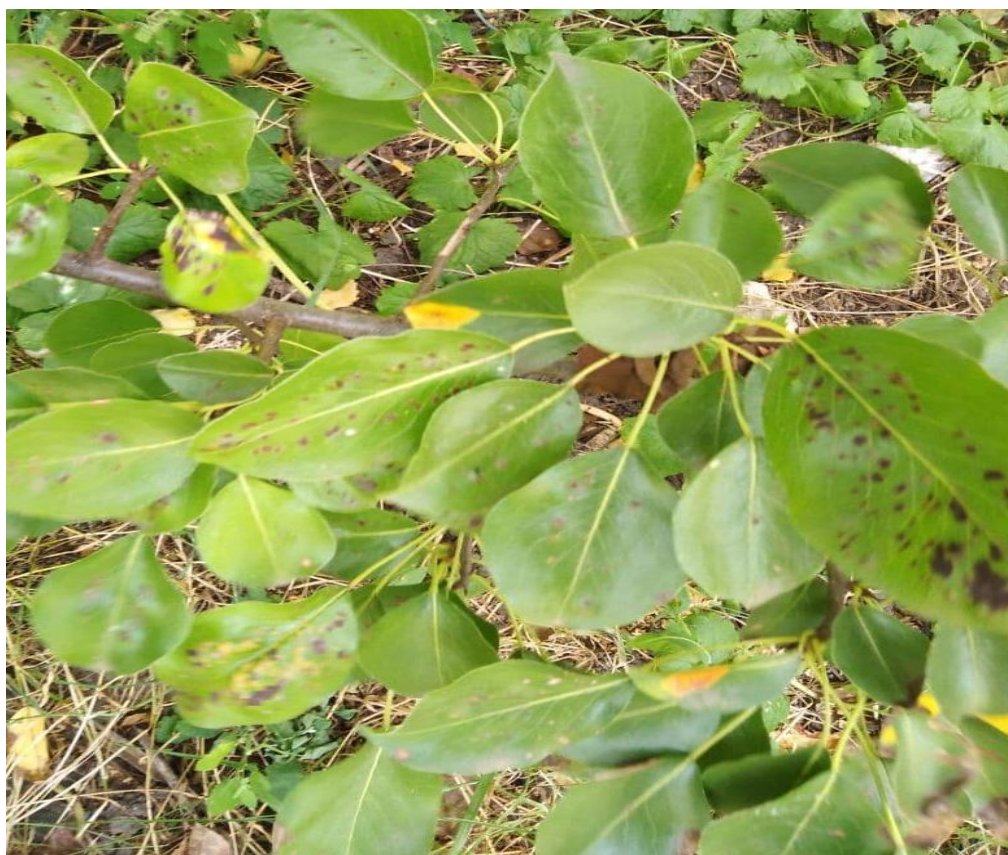
Коніотирій оливковий – Coniothyrium olivaceum Bonord.