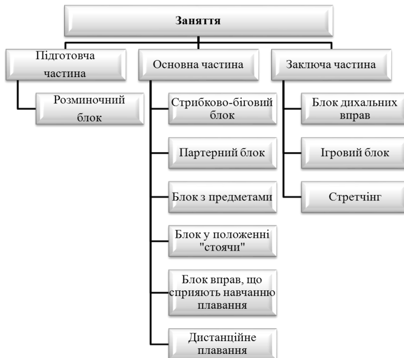
Рис. 1. Типова структура заняття аквафітнесом для студентів

Основна частина заняття закінчувалась пропливанням дистанції 50–100 метрів для тих, хто добре вмiє плавати, й 25–50 метрів для тих, хто не досить володiє навичками плавання, за допомогою дощок (рис. 1).