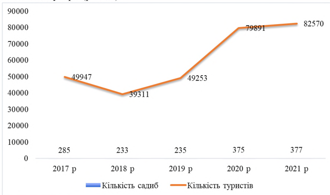
Рис. 2. Динаміка кількості туристів та садіб в Україні, які відвідали за період 2017-2021 рр. (складено авторами на основі даних [7])

Зростання доходів населення певним чином сприяло розвитку внутрішнього туризму, зокрема сільського туризму, а також підвищенню попиту відпочивальників на мандрівки до регіонів, що раніше ще не були популярними. Упродовж останніх років простежується тенденція до зростання кількості іноземних туристів, яка свідчить про позитивні процеси в українській туристичній індустрії (рис. 2.).