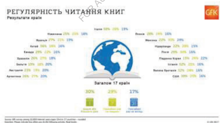
Abb.3.2. Regelmäßigkeit des Bücherlesens (aus sozialen Netzwerken übernommen).