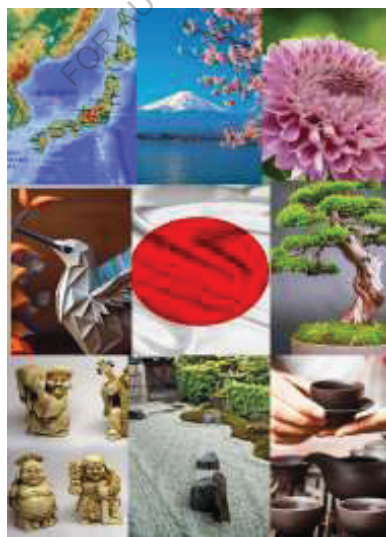
(Kinder kommentieren das Bild).

Kinder, auf euch wartet ein Kreuzworträtsel zum Thema „Japanische Kultur“. Es wird uns helfen, uns alles, woran Sie sich über dieses Land erinnern, visuell vorzustellen und vielleicht etwas Neues zu lernen. Sehen wir uns jedes Element des Quersinns an und kommentieren wir es.