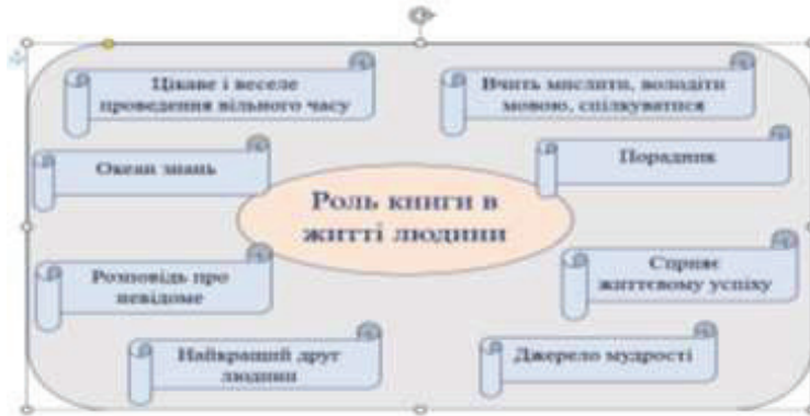
Abbildung 3.3. Die Rolle von Büchern im menschlichen Leben (Werk des Autors)

3) Sehen Sie sich das Video zum Thema Berufung an: https://www.youtube.com/watch?v=vafIzTUq0b0&list=PPSV .