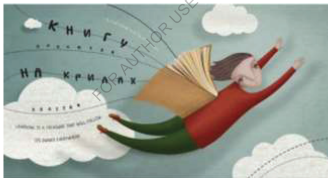
Abb.3.1. Wir tragen das Buch auf unseren Flügeln (Bild aus den sozialen Netzwerken).

Um die inhaltliche Wahrnehmung des Textes zu verbessern, wurde Abbildung 3.1 hinzugefügt, die die Essenz der Hauptidee wiedergibt: Lesen als Prozess der Aneignung lebenswichtiger Informationen inspiriert einen Menschen, eröffnet neue Möglichkeiten, hilft beim Erwerb und der Ausbildung grundlegender Lebenskompetenzen und bietet Möglichkeiten, gesetzte Ziele zu erreichen.