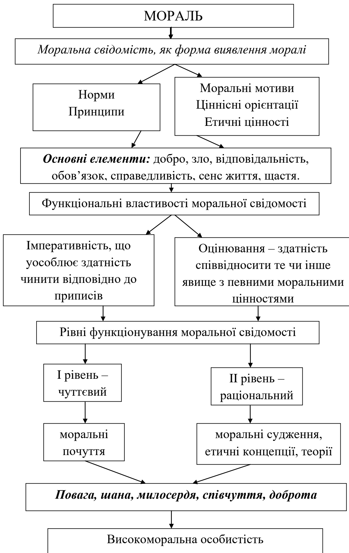
Рис. 1.1. Структурні елементи поняття «мораль», «моральна свідомість»