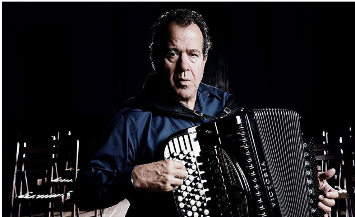
Рішар Гальяно. Фото.