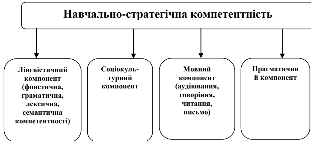
Рис. 3. Структурні компоненти навчально-стратегічної компетентності

На рис. 3 ми наводимо структурні компоненти навчально-стратегічної компетентності.