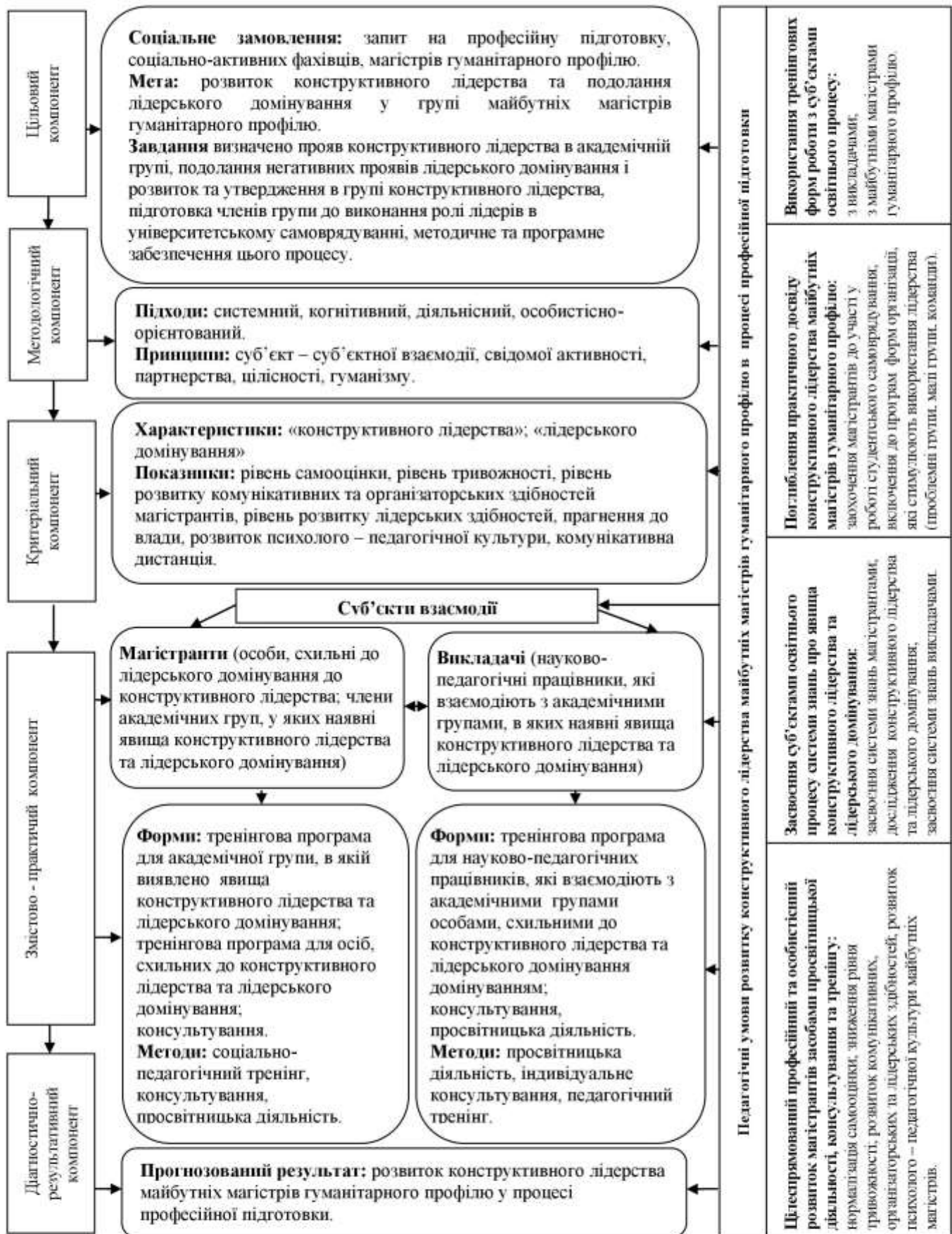
Рис. 1. Модель реалізації педагогічних умов розвитку конструктивного лідерства майбутніх магістрів гуманітарного профілю у процесі професійної підготовки