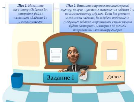
Рис. 2. Слайд 4