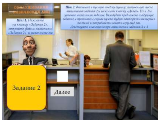
Рис. 5. Слайд 7