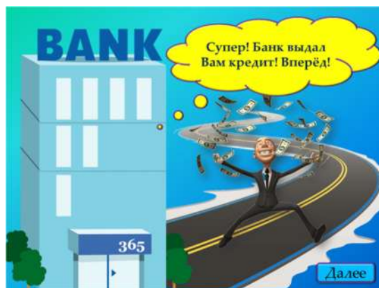
Рис. 6. Слайд 8