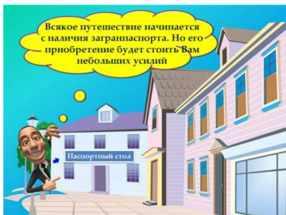
Рис. 1. Слайд 3

Игра разбита на четыре этапа, своего рода препятствия (рис. 1-7). Каждый этап содержит определенное количество вопросов, выполненных в тестовой оболочке MyTestXPro. При нажатии на кнопку с номером задания (см. рис. 2 и рис. 5) появляется окно «Модуль тестирования». С помощью него выполняется открытие соответствующего задания, регистрация (студент вписывает фамилию, имя и группу) и выполнение тестирования.