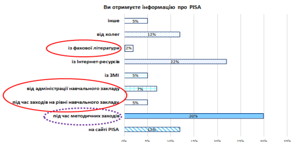
Рис. 2. Основні джерела інформації щодо PISA

не розуміють що міжнародне дослідження PISA не прив'язане до конкретних навчальних планів та програм, як вже зазначалось вище Лише 24% опитаних учителів змогли вибрати правильне визначення читацької грамотності, що буде провідною галуззю дослідження у 2018 році.