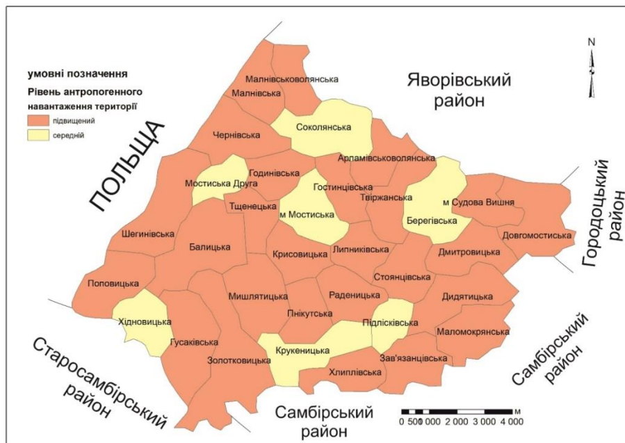
Рис. 3. Рівень антропогенного навантаження на земельні ресурси Мостиського району

Висновки. В останні роки відзначаємо в межах Мостиського району зменшення площ сільськогосподарських земель, спостерігаємо стабілізацію площ земель лісового фонду, значне збільшення площ забудованих земель і земель водного фонду.