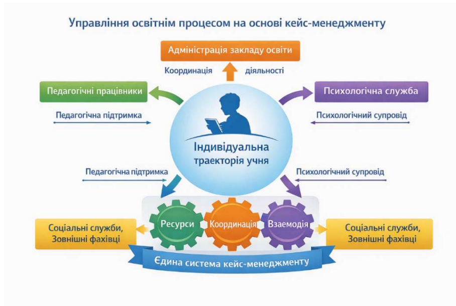
Рис. 1. Управління освітнім процесом на основі кейс-менеджменту (текст написано авторкою, рисунок згенеровано ШІ)

– Структурно-функціональна інтеграція – включення кейс-менеджменту до системи внутрішнього забезпечення якості освіти, визначення його місця у загальній управлінській структурі закладу.