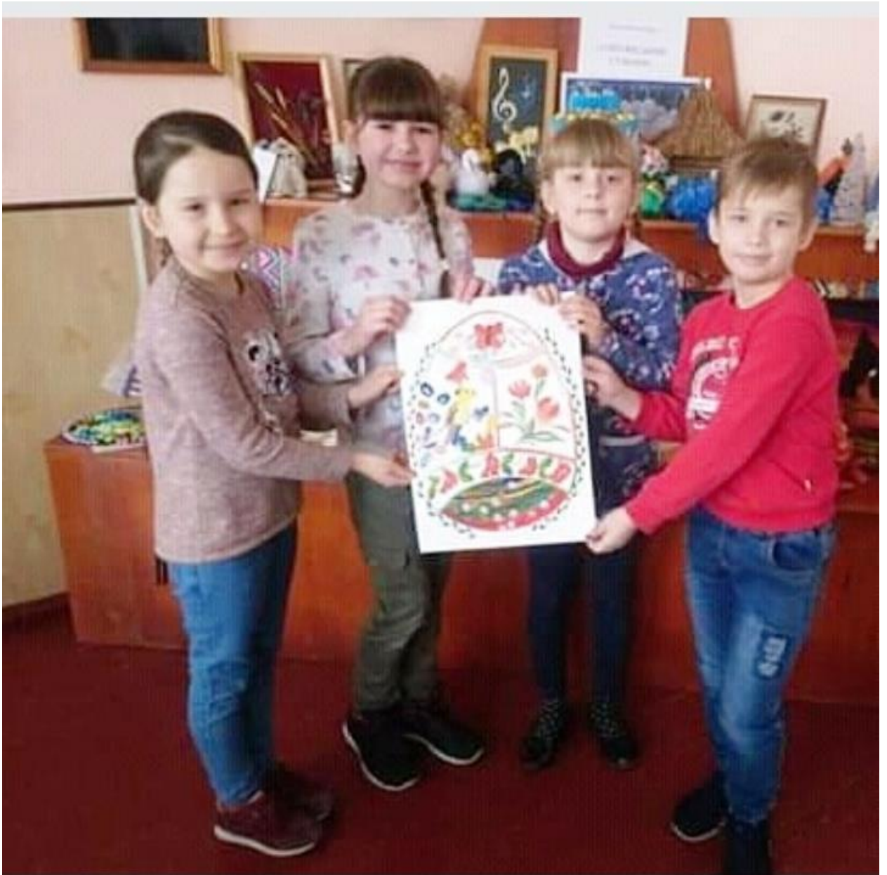
Вихованці школи мистецтв