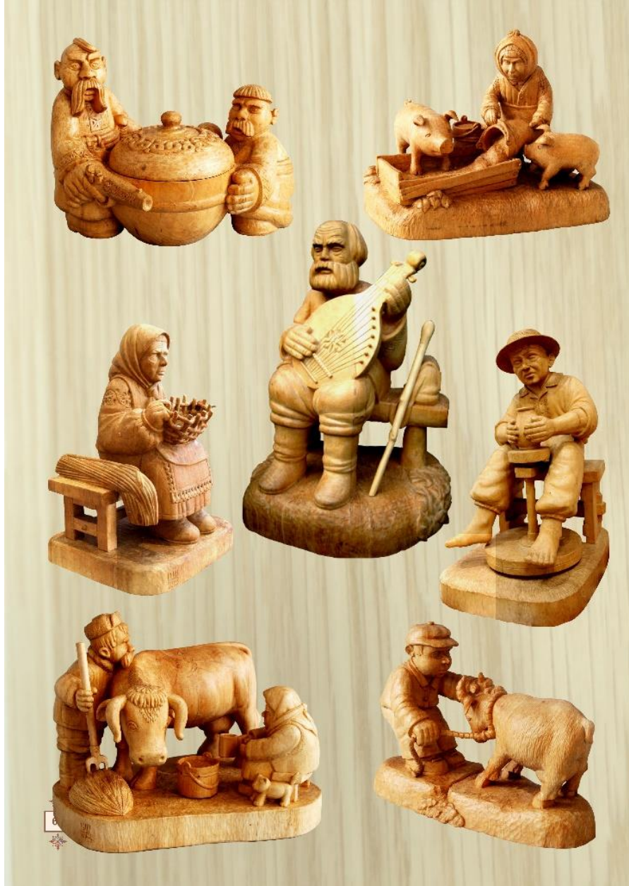
Рис.2.3. Творчість. Шума. В.А.