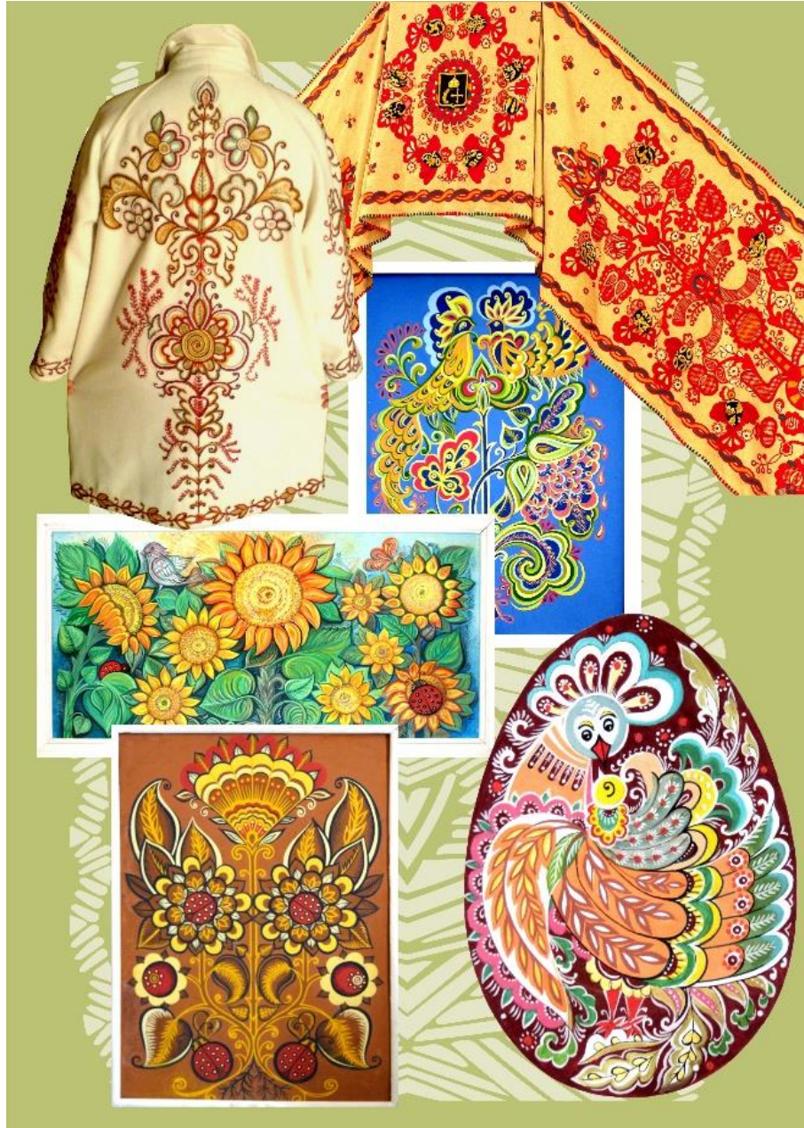
Рис.2.2 Творчість. Гудилко. Н.С.