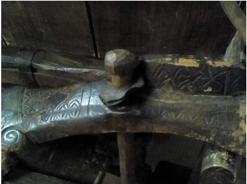
Рис.1.2 Різьблення по дереву.(деталі возу) XIX ст.