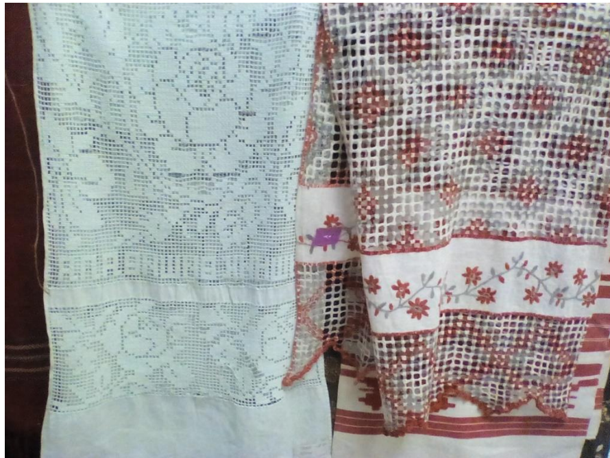
Рис.1.1. Рушники характерні Слобожанщині. 50 роки ХХ ст.