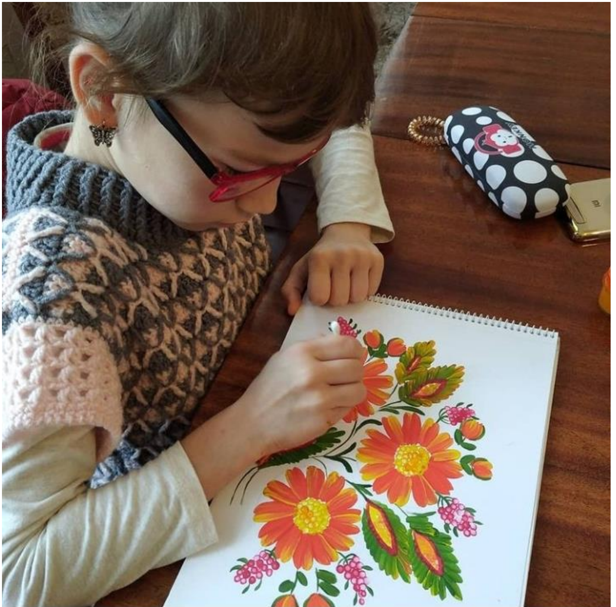
Декоративний розпис Базарної Марії