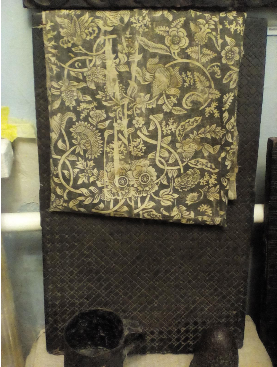
Рис 1.3. Вибійка на тканині Слобожанщини.