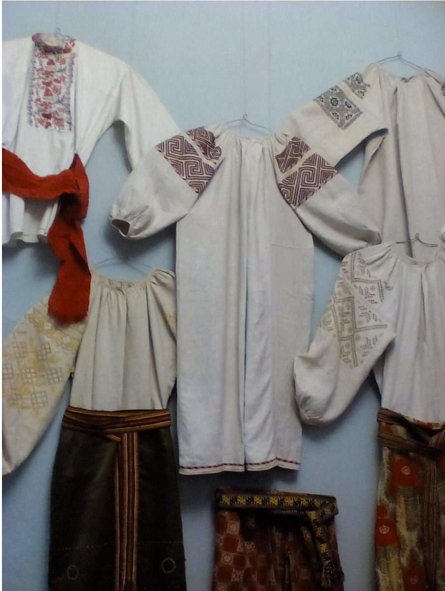
Рис 1.4. Традиційне українське вбрання. Поч. XX ст.