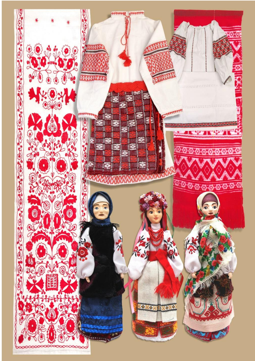
Рис. 2.4. Творчість. Гордієнко. Н.О