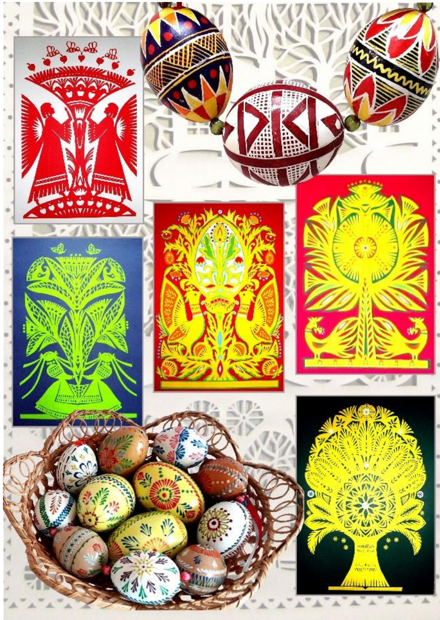
Рис.2.1. Народні майстри сьогодення.