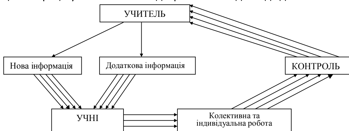
Рис. 1. Структура процесу навчання (за Р. А. Хабібом)

Р. А. Хабіб [5] пропонує розглядати процес навчання математики у школі як інформаційний і досліджувати його з позиції функціонування та руху навчальної інформації в системі «учитель – навчальні засоби – учні» (рис. 1). Дві основні групи видів навчальної інформації складає інформація прямого зв'язку (від учителя до учнів) та інформація зворотного зв'язку (від учнів до вчителя). Наголошується на негативному впливі на процес навчання затримки й нерегулярності оцінювання правильності дій учня, тим самим підкреслюється значення зворотного зв'язку під час навчання. Проте, діяльність учителя й учнів за результатами такої зворотної інформації чітко не визначається, тобто прослідковується деякою мірою замкненість окремих циклів процесу навчання та їх відокремленість один від одного.