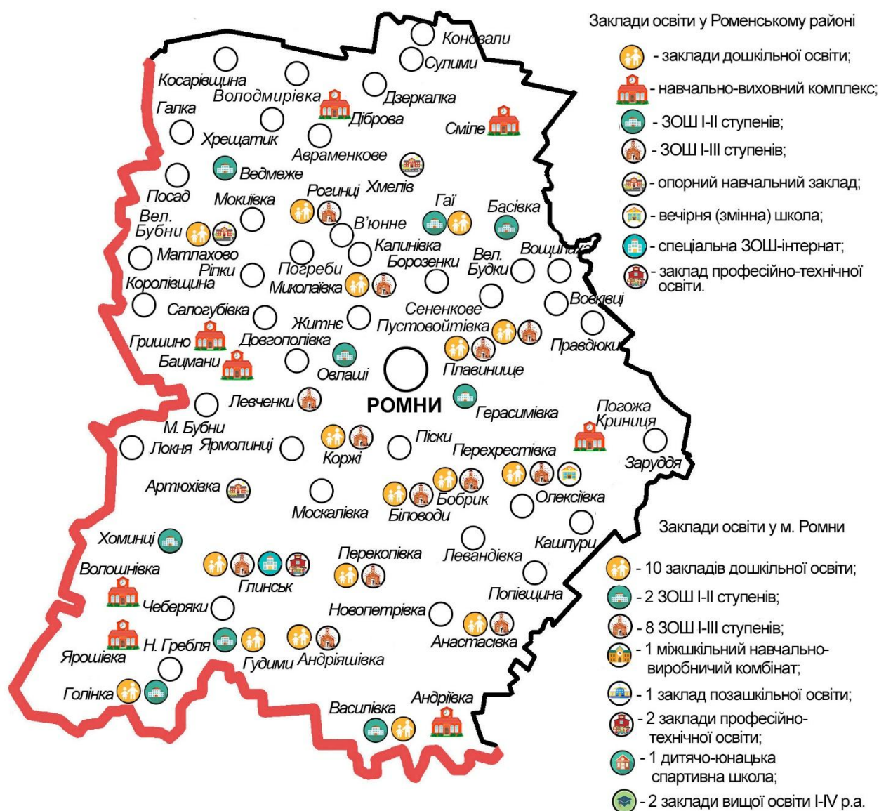
Рис. 1. Мережа закладів освіти Роменського району (станом на 01.01.2019 р.)

Станом на 01.01.2019 р. [11] соціально-культурне обслуговування Роменського району представлене мережею закладів культури різного типу (рис. 2). Так, у м. Ромни культурні послуги населенню надають Роменський міський будинок культури, 5 бібліотек (центральна міська бібліотека для дорослих ім. Бориса Антоненка-Давидовича (ЦМБ для дорослих), центральна міська бібліотека для дітей (ЦМБ для дітей), філіал «Бібліотека сімейного читання», філіал №1 ЦМБ для дорослих, філіал №1 ЦМБ для дітей, дитяча музична школа, 3 музеї у м. Ромни (Роменський краєзнавчий музей, народний музей НВК №2 ім. академіка А.Ф. Йоффе, народний музей О.А. Деревської).