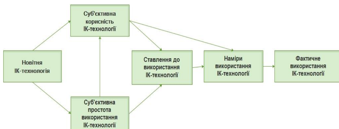
Рис. 4. Модель сприйняття ІК-технології педагогами (за Ф. Девісом)

Розглянемо «Модель сприйняття технології» Фреда Девіса (від англ. Technology Acceptance Model, (TAM)) як методику оцінювання ефективності використання інноваційної ІК-технології (Davis, 1989) (рис. 4).