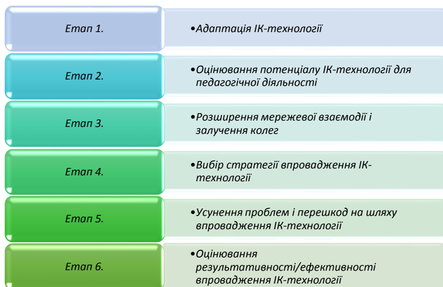
Рис. 3. Процедурна модель впровадження ІК-технологій в освітній процес

Розглянемо процедурну модель впровадження ІК-технологій за якою можна впроваджувати СКМод в освітній процес, що дозволить забезпечити якісні перетворення процесу вивчення природничо-математичних предметів (Литвинова, 2016) (рис. 3).