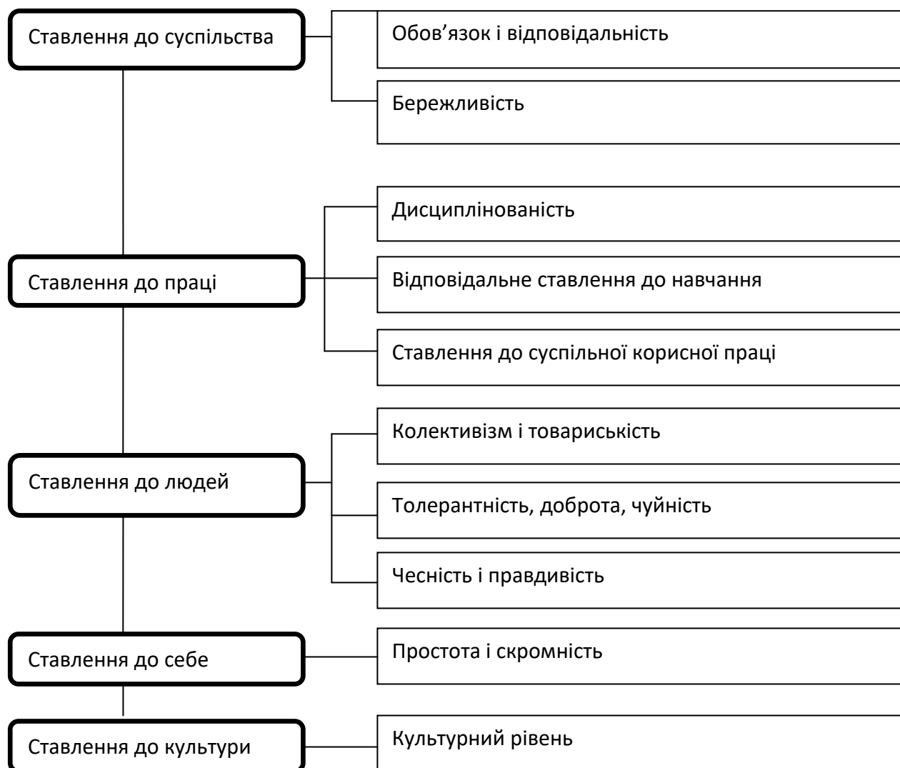
Рис. 2. Критерії та показники визначення рівня вихованості дітей дошкільного віку із ЗПР

До того ж, вважаємо за необхідне зазначити, що спеціальний освітній процес для дітей дошкільного віку із ЗПР повинен протікати в спеціальних освітніх умовах, які передбачають: освітнє середовище (комплекс умов, які забезпечують розвиток дітей у дошкільній організації: взаємодія учасників педагогічного процесу, розвивальне предметно просторове середовище (частина освітнього середовища, що являє собою спеціально-організований простір, матеріали, обладнання для розвитку дітей дошкільного віку відповідно до їх психолого-педагогічних характеристик), зміст дошкільної освіти); організаційне забезпечення (нормативно-правове забезпечення; організація різних форм навчання в спеціальних закладах дошкільної освіти; фінансові умови, інформаційне забезпечення); матеріально-технічне забезпечення (навчально-методичний комплект, обладнання, оснащення відповідно до вікових та індивідуальних особливостей дітей, санітарно-епідеміологічних вимог,