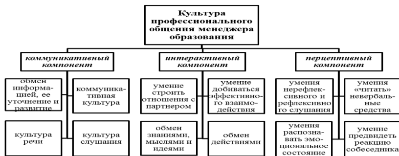
Рис. 1. Культура профессионального общения менеджера образования

В соответствии с этим структура культуры профессионального общения менеджера образования может быть схематично изображена следующим образом (рис. 1).