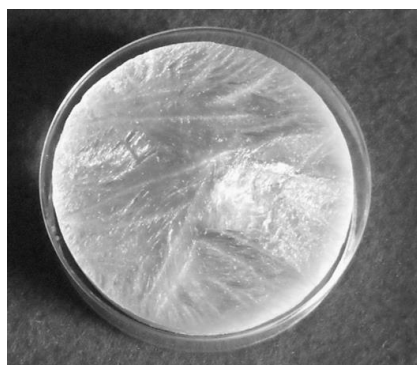
Рис. 1. Пориста губка біоматеріалу йодиду хітозану з аргентум (I) нітратом.

Структуру отриманих біоматеріалів досліджували методом електронної мікроскопії, яку ілюструє рис. 2.