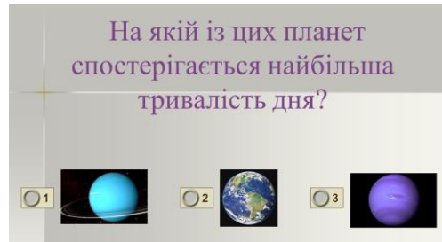
Рис. 3. Інтерактивні графічні тести для контролю знань. Тема «Планети Сонячної системи»

У будь-який момент розробки тесту можливо додавати або видаляти слайди із завданнями та інформаційні слайди, довільно змінювати порядок їх появи.