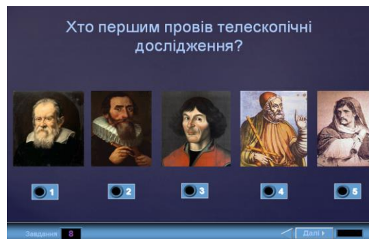
Рис. 4. Фрагмент інтерактивного графічного тесту для контролю знань. Тема «Методи та засоби астрономічних досліджень»

Кількість варіантів відповідей для вибору - від двох до шести, а на слайдах з переміщуваними об'єктами - до десяти, і можуть бути різними на різних слайдах.