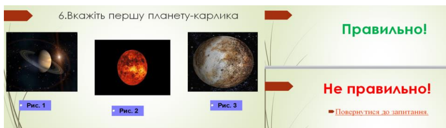
Рис. 1. Приклад інтерактивного графічного тестового запитання для самоперевірки

Інтерактивні графічні тести для контролю знань у MS PowerPoint базуються на використанні Visual Basic for Application (VBA). Для запуску конструктора тестів необхідно вимкнути внутрішню систему безпеки та запустити («дозволити використання») макроси (рис. 2-4.).