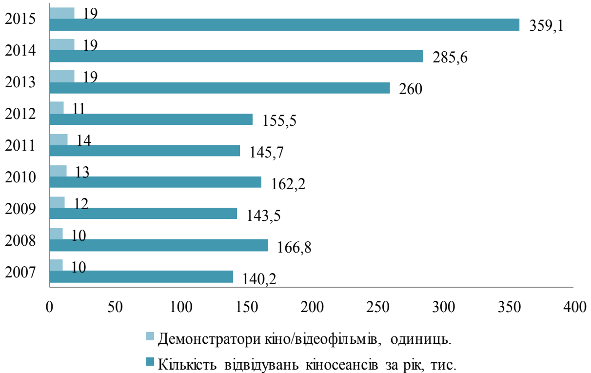
Рис. 3. Діяльність підприємств кіномережі в Сумській області протягом 2007-2015 рр. (побудовано за даними [6; 7])

У розрізі адміністративних одиниць найбільшу кількість демонстраторів має м. Суми – 8, у Шосткинському районі їх 4 (2 в місті Шостка), у містах Конотопі та Глухові по одному. Також по одному такому демонстратору є у Краснопільському, Охтирському, Середино-Будському, Сумському та Тростянецькому районах.