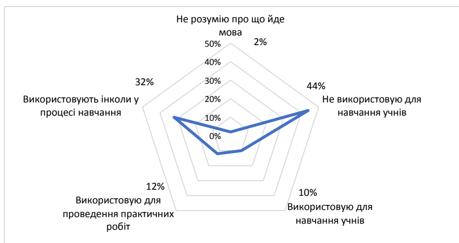
Рис. 3. Використання СКМод для навчання учнів

На запитання про використання цифрових симуляторів 10% вчителів зазначили, що використовують СКМод в навчальній діяльності учнів, 44% – зазначили, що не використовують СКМод, а 2% - відповіли, що не розуміють про що йде мова. Деякі вчителі, частка яких склала 32% вказали, що застосовують СКМод не систематично; а 12% - застосовують СКМод під час практичних робіт (рис. 3).