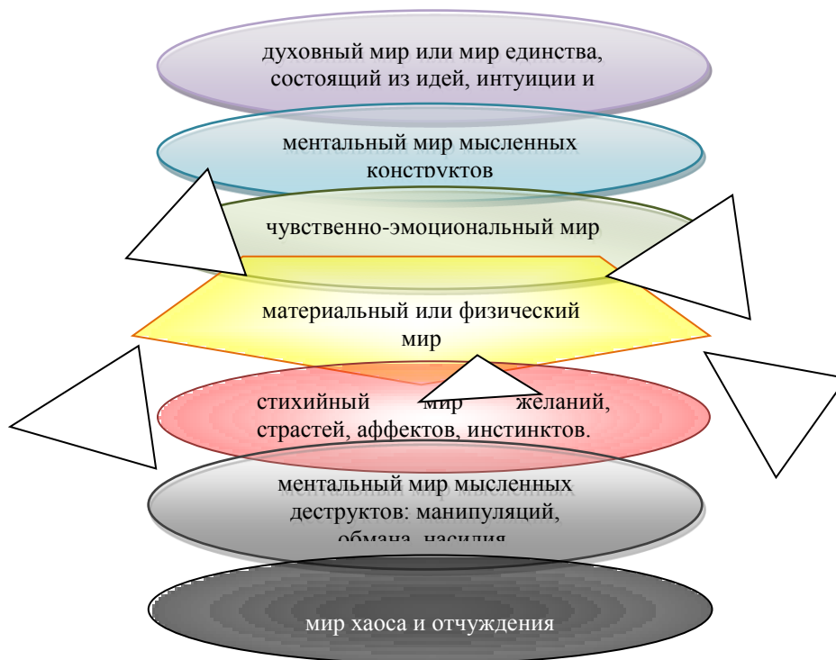
Рис. 2. Модель онтологических уровней системы «Человек».

Сам процесс контакта можно наглядно смоделировать на физическом примере сообщающихся сосудов с водой, где сосуды – это определенные онтологии, а качество воды в этих сосудах – это порядок организации этих онтологий, онтика – это каналы, соединяющие человека с внешним миром (на рисунке «онтические стражи» отражены в виде пяти треугольников, прикрепленных к «физической онтологии»). Онтологические уровни с более высоким порядком находятся над онтологиями с более низким порядком организации (рис. 2).