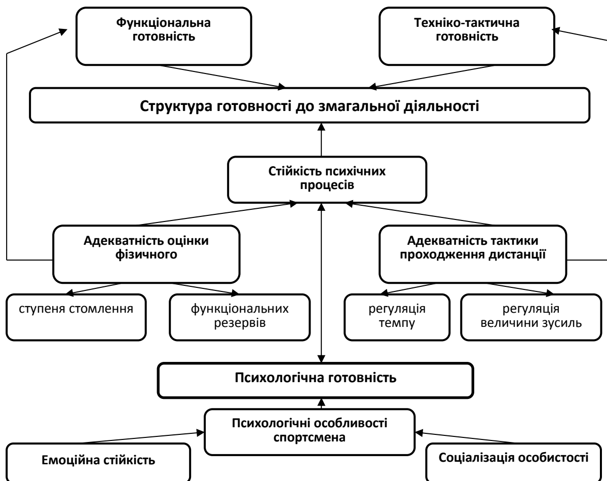
Рис. 1. Структура готовності плавців до змагальної діяльності

паралімпійського спорту суб'єктів спортивної діяльності в напружених умовах передзмагальної та змагальної фази. Ці показники характеризують психічний і особистісний розвиток плавців, а також стійкість психічних процесів до дії відволікаючих факторів до початку та за ходом змагання [3, 123–125] (рис. 1).