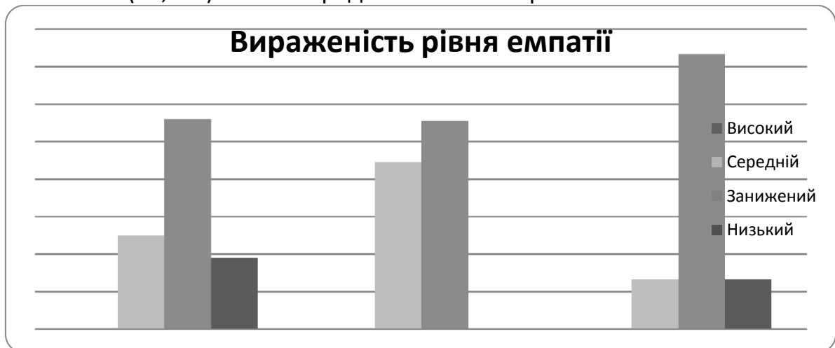
Рис 2. Показники ступеню прояву загального рівня емпатії (%) у групах А, В, С (за методикою В. Бойка)

У групі В (музичне мистецтво) середній та занижений рівень мають 44,5 % та 55,5 % відповідно. Респондентів з низьким рівнем емпатійних здібностей у цій групі не виявлено. Що ж до третьої групи (математика), то в ній більшість має занижений рівень 73,4 % і однакова кількість по 2 чоловіка (13,3 %) мають середній та низький рівень.