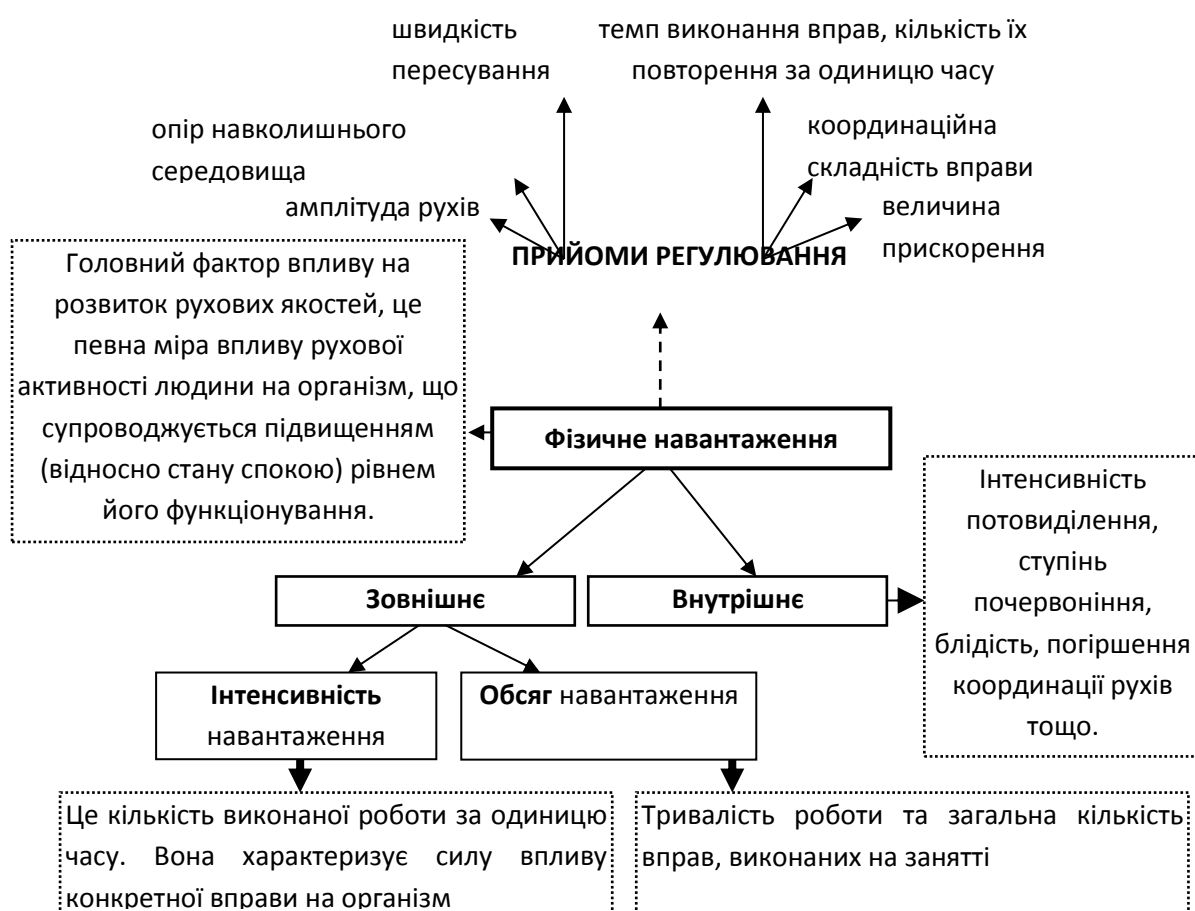
Рис. 2. Схематичне подання інформації до теми «Теоретико-

Необхідною умовою засвоєння студентами навчальної інформації та активізації пізнавального інтересу вважаємо укладання практикумів із навчальних дисциплін . Подаємо структуру тем «Практикуму з методики фізичного виховання дітей»: тема, мета, обладнання, ключові слова, зміст; основна література, додаткова література; контрольні запитання; завдання до практичного заняття, завдання до лабораторного заняття; інформаційне забезпечення заняття: теоретичний блок (представлена коротка відповідь на питання зі змісту теми), практичний блок (представлені розробки різних форм фізичного виховання відповідно до теми заняття). Таке структурування характерне для кожної теми навчальної дисципліни. У кінці практикуму подаються завдання для самоперевірки до кожної теми, додатки, основну та додаткову літературу до навчальної дисципліни за такими групами: державні освітянські документи, підручники та посібники, статті в періодичних виданнях. У практикумах доцільно використовувати різні види подання інформації: текстові, графічні, схематичні (рис. 2) тощо. Практикум можна використовувати під час лекційних, практичних та лабораторних занять. На нашу думку, визначений вид друкованої продукції сприятиме зменшенню часу на пошук відповідної інформації та збільшенню часу для творчого опрацювання та засвоєння студентами навчального матеріалу.