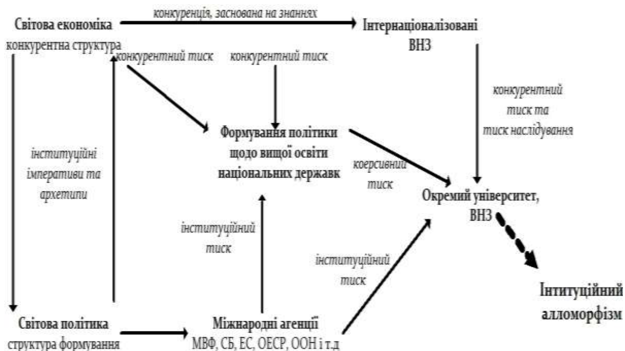
Рис. 1. Джерела алломорфічного тиску та процес алломорфічних змін [складено авторами на основі 7]

На нашу думку, алломорфічний підхід є бажаним вибором для українських університетів, оскільки саме такий підхід дозволяє одночасно зі збереженням певних традицій та усталених підходів застосовувати нові, прогресивні форми.