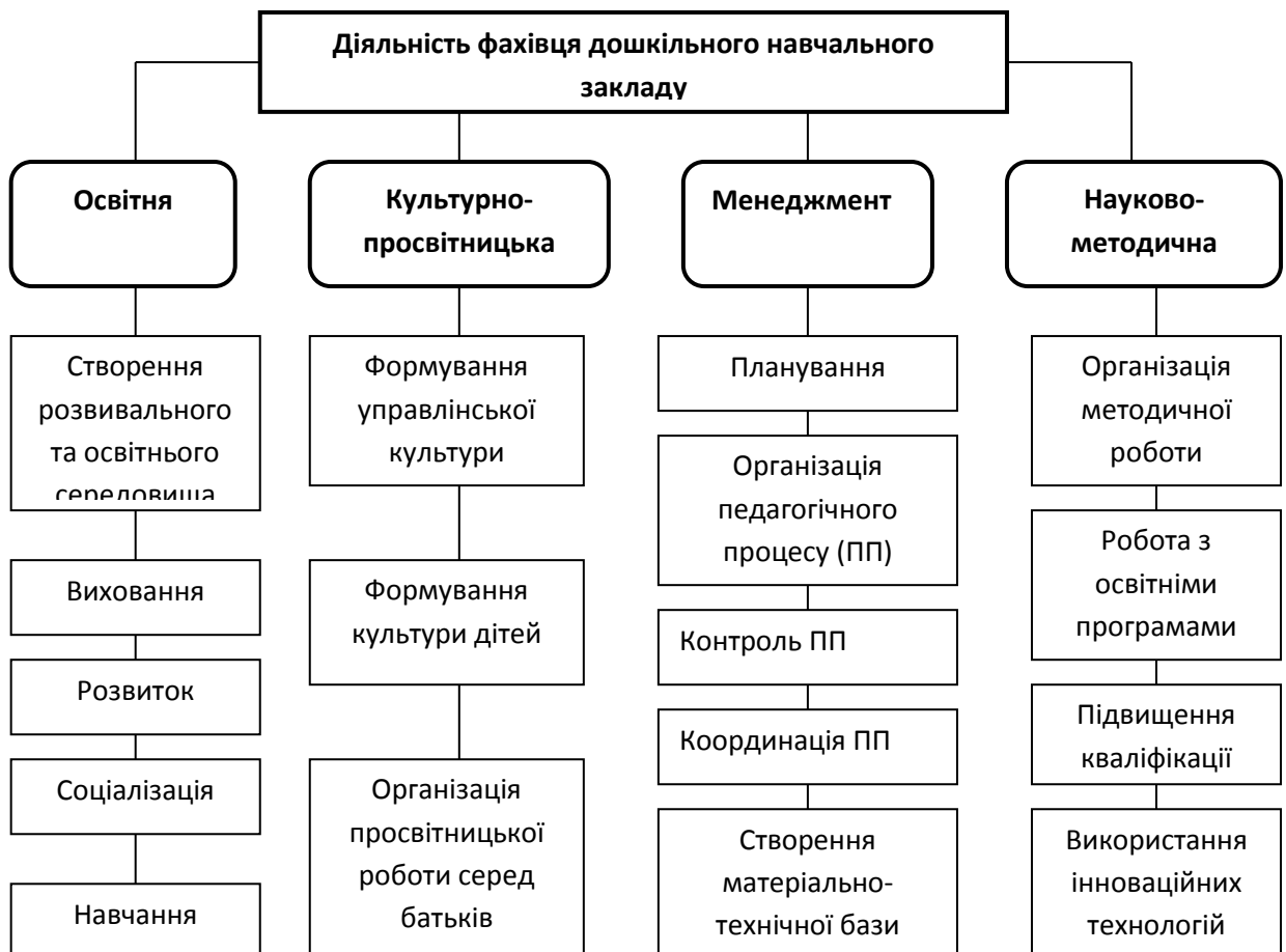
Рис. 2. Структура педагога дошкільної освіти

Досить важливим для реалізації компетентнісного підходу є визначення структури діяльності майбутнього фахівця дошкільного виховання (рис. 2).