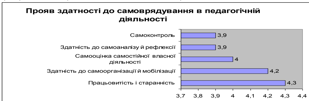
Рис. 2. Результати оцінювання вчителями рівня сформованості вмій і навичок до самоосвіти (блок «Прояв здатності до самоврядування в педагогічній діяльності»)

самоаналізу власних педагогічних дій, здійснення рефлексивної діяльності. Цей факт обумовив обов'язковість залучення учасників ШПМВІ до тренувальних вправ щодо самоменеджменту.